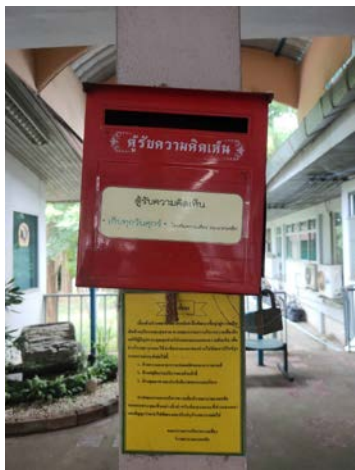
รูปภาพ ๑ กล่องรับความคิดเห็น