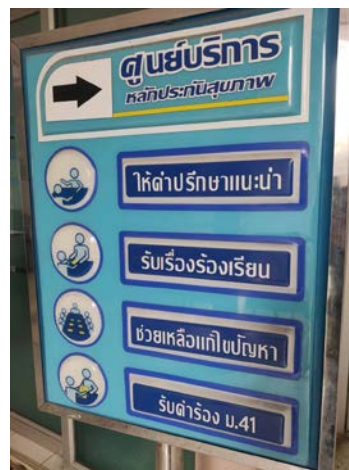
รูปที่ ๒ ป้ายศูนย์รับเรื่องร้องเรียน