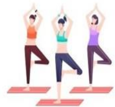
เพิ่มมูลค่าเศรษฐกิจสุขภาพ (Wellness Economy) ต่อหัวประชากร เพิ่มสูงขึ้นมากกว่าค่าเฉลี่ย ของประเทศ