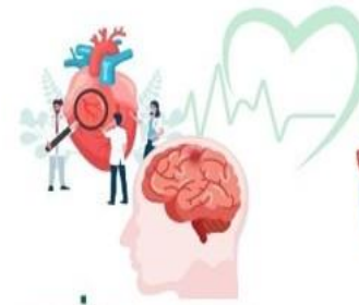
ลดป่วย ลดตาย ลดแออัด