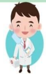
เพิ่มศักยภาพ บริการด้านอายุรกรรม