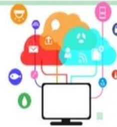
พัฒนาระบบเทคโนโลยี สารสนเทศด้านสุขภาพ