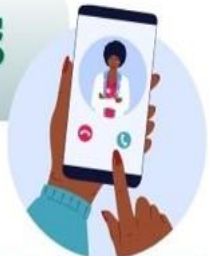
มีระบบนัดหมายและระบบบริการ BU Platform Digital ที่มีประชาชนเข้าใช้ งานสูงที่สุดในประเทศ