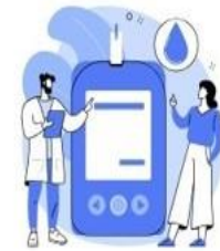
เป็นจังหวัดที่มีอัตรา DM Remission สูงสุดในประเทศ