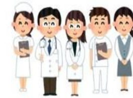
มีระบบจัดการความขัดแย้งทางการ แพทย์ดีที่สุดในประเทศ