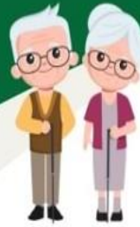
การดูแลผู้สูงอายุ